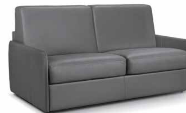
Pelle grigia / Cuir toscana gris