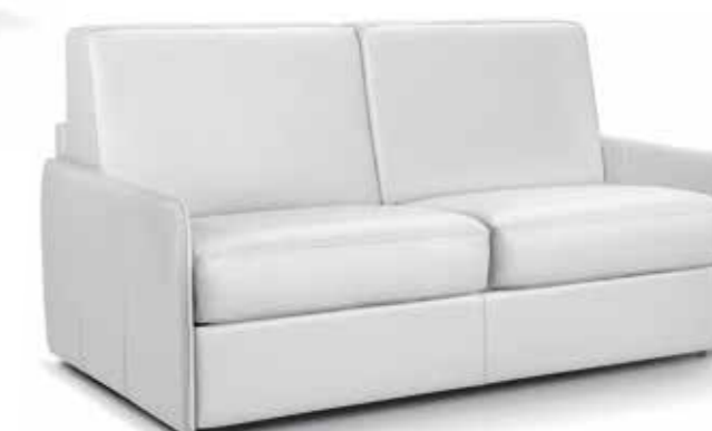
Pelle bianca / Cuir toscana blanc