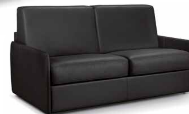
Pelle nera / Cuir toscana noir